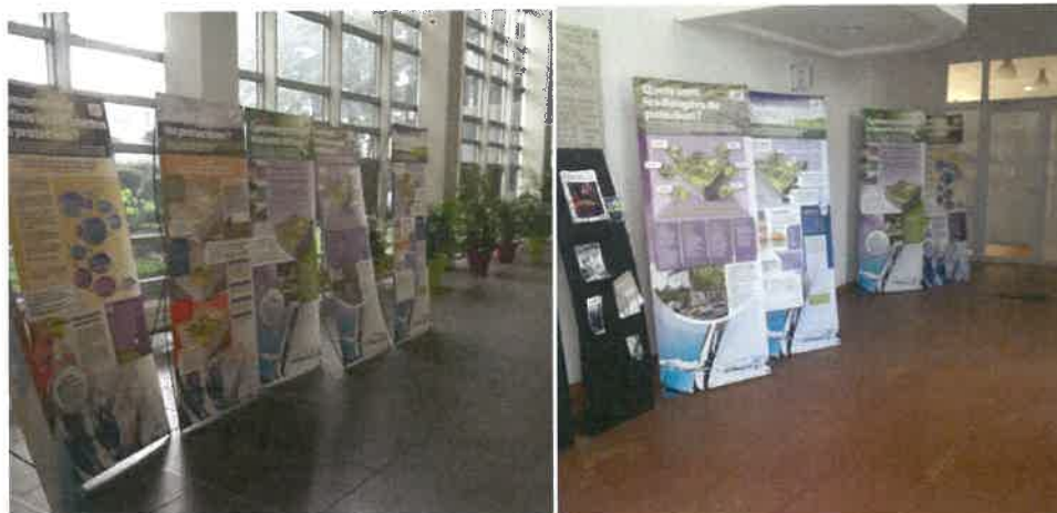
Présentation des panneaux accompagnant l'enquête publique, dans le hall d'accueil de la mairie de Cergy